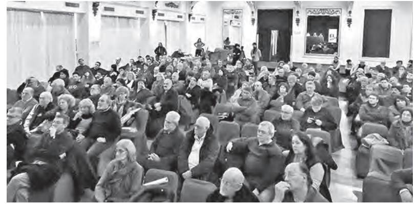
Asistentes en El Palacio