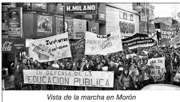
Vista de la marcha en Morón

Presidente Centro de Estudiantes ISFD 45 Haedo