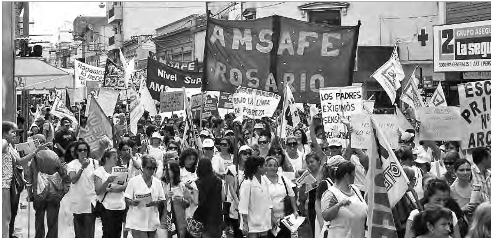
El triunfo en Amsafe Rosario lo es también para la docencia nacional

¡Es un gran triunfo también para la docencia a nivel nacional! Amsafe Rosario “recuperada” tiene una tradición unitaria y de lucha y es parte de la construcción del sindicalismo combativo. En el año 2004 se logra ganar el gremio rosarino a la burocracia, siendo uno de los primeros recuperados para los sectores combativos, similar a los Suteba Multicolores.