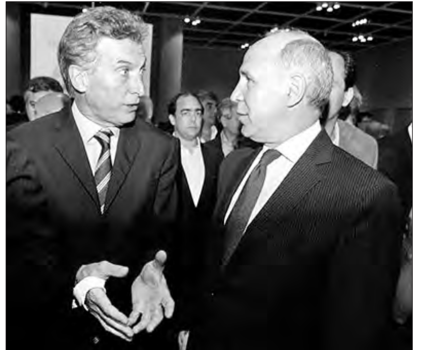
La corte apoya el ajuste de Macri

A lo largo de la historia muchos fallos y políticas antiobreras se han frenado, lográndose que no se apliquen. Un ejemplo es el protocolo antipiquete de Macri que intentó aplicarlo pero a fuerza de marchas y cortes reconoció que en la ciudad de Buenos Aires y en provincia no lo va a hacer. Eso no quiere decir que el gobierno abandonó su política represiva, sino que con la movili-