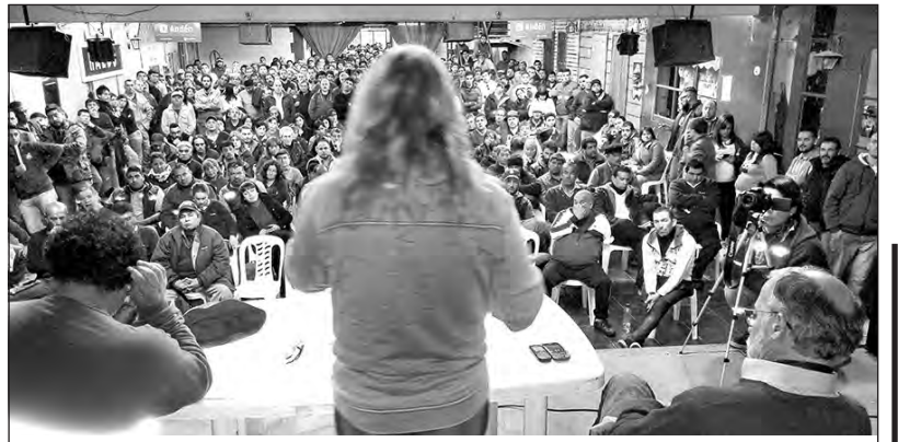
Vista de la asamblea en la seccional Haedo

Otra de las importantes resoluciones tomadas fue la de exigir a la conducción nacional de la Unión Ferroviaria que rompa