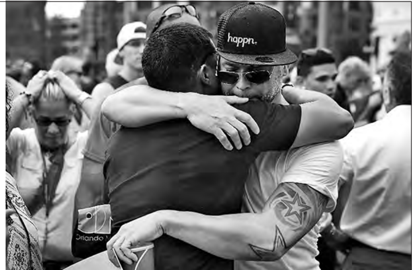
Desde la izquierda nos solidarizamos con los familiares y amigos de las víctimas y rechazamos que este atentado sea usado por el imperialismo para aumentar la represión

de exclusión, marginación y discriminación contra los homosexuales.