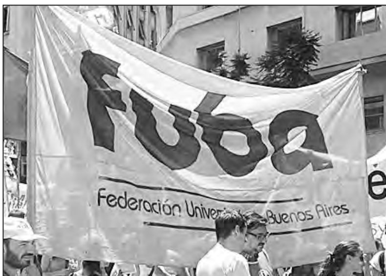
Para frenar el ajuste de Macri hay que ampliar los acuerdos con los sectores combativos y la izquierda en la FUBA

El "Frente por un nuevo 1918" que conduce la FUBA (integrado por UJS/Partido Obrero; La Mella/Patria Grande; Comunismo Revolucionario y nuestra Juventud de Izquierda Socialista) no desarrolló una posición en común sobre cómo salir adelante de la actual situación. En particular, desde nuestra juventud rechazamos la propuesta que PO y La Mella hicieron hasta último momento, de intentar armar una lista en común con La Cántora y el kirchnerismo. Acuerdo que se demostró profun-